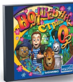
Волшебник страны ОЗ

В общем, если у вас или вашего подрастающего бездельника проблемы с химией, то зайдите в Золотой город. Если ничему не научитесь, то хотя бы поиграете на славу! ■ ■ ■